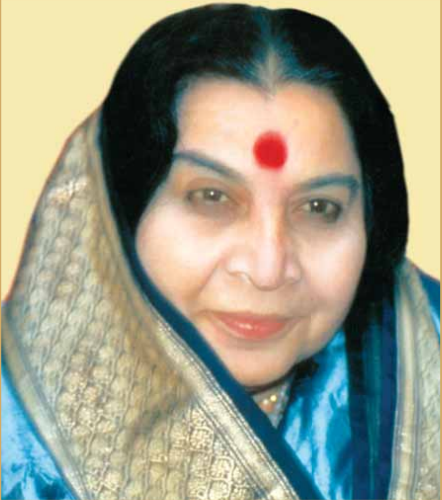
माताजी श्री निर्मला देवी